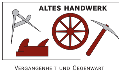
VERGANGENHEIT UND GEGENWART

Glasl: In einzelnen Berufen mussten andere Schwerpunkte gesetzt werden, weg von der Produktion, hin zu Service und Dienstleistung. Ein klassisches Beispiel ist hier der Uhrmacher, der im Normalfall ja keine Uhren mehr fertigt, aber sie repariert und wartet.