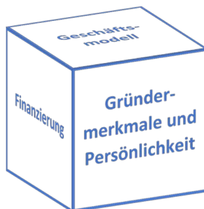
Abbildung 1: Einordnung der Gründermerkmale und Persönlichkeitseigenschaften als Erfolgsfaktoren für eine Unternehmensgründung

In Abbildung 1 wird ein allgemeines Schaubild aufgezeigt, welches den Rahmen dieses Fragebogens abstecken soll. Um Aussagen über die Erfolgswahrscheinlichkeit eines Unternehmens tätigen zu können, müssen viele verschiedene Facetten von der konjunkturellen Lage über die finanzielle Ausstattung des Gründers zur richtigen Auswahl des Geschäftsmodells betrachtet werden. In diesem Kontext auch die Gründermerkmale und Persönlichkeitseigenschaften eine große Rolle, welchen den Schwerpunkt dieser Arbeit darstellen. Um bestehende Verbesserungspotentiale frühzeitig zu erkennen, soll dieser Fragebogen dazu dienen, ein erstes Abbild ihrer Gründermerkmale und Persönlichkeitseigenschaften widerzuspiegeln. Das Ergebnis (beispielhaft in Abbildung 2 dargestellt) kann dann mit dem Berater der Handwerkskammer in einer Gründungsberatung besprochen werden und darauf eingehend Möglichkeiten aufgezeigt werden, wie bestehende Verbesserungspotentiale angegangen werden und erlernt werden können.